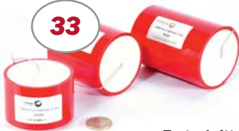
Fortschritte bei Audio-Kondensatoren