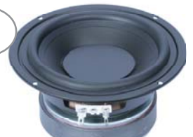
13-cm-Treiber für kleine Subwoofer