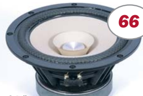
Breitbänder für Horn und Bassreflex